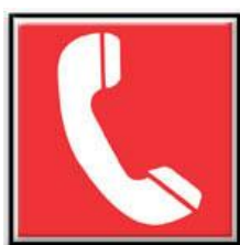
Téléphone de lutte contre l'incendie