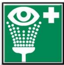
Rinçage des yeux