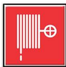
Lance à incendie