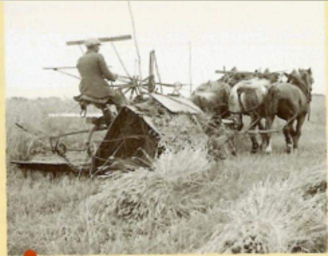
En 1910, ce chiffre passe à 13,2 quintaux de blé à l'hectare.

Quelles réalités économiques sont décrites dans la succession de ces trois photos ?