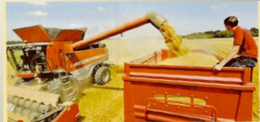
Depuis une dizaine d'années, on produit autour de 70 quintaux de blé à l'hectare.

Quelles réalités économiques sont décrites dans la succession de ces trois photos ?