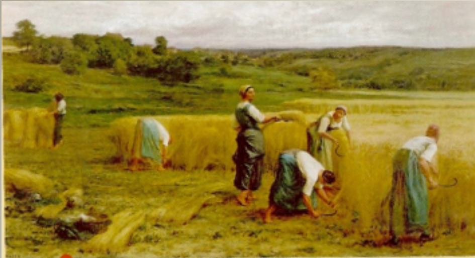
En 1800, on produisait 8,5 quintaux de blé à l'hectare. (Léon Augustin Lhermite, Moisson , 1874. Musée des Beaux-Arts, Carcassonne.)