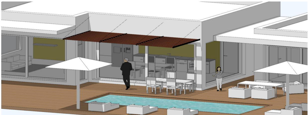
Mise en situation du brise-soleil