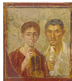
Portrait de Terentius Neo et de sa femme, Pompei, Maison de Terentius Neo, VII 2, 6. Musée archéologique national de Naples