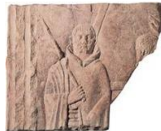
Bas-relief en grès. Musée luxembourgeois d'Arlon (Belgique)