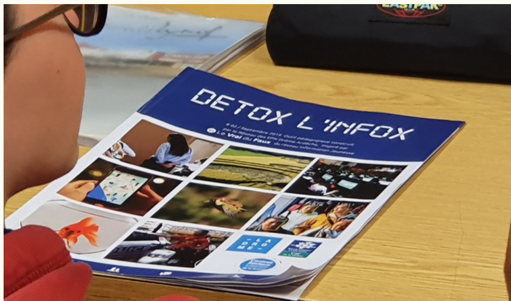
Twitter, collègue Marcel Pagnol

LO SCORSO ANNO, IL PROVVEDITORATO DI TOLOSA HA BANDITO UN CONCORSO DAL TITOLO "DETOX L'INFO(X)", CHE CONSISTEVA NEL CREARE UNA FALSA INFORMAZIONE E DI SPIEGARNE POI IL PROCESSO DI CREAZIONE. FINO AD ORA NIENTE DI ALLARMANTE. MA DIVERSI PARTECIPANTI HANNO DICHIARATO DI NON AVER MAI RICEVUTO NOTIZIA DEL LORO LAVORO. LE INDAGINI SI SONO CONCENTRATE SUI LOCALI DELLA F.E.S (FLAT EARTH SOCIETY, IN ITALIANO "LA SOCIETÀ DELLA TERRA PIATTA") E I LAVORI SAREBBERO STATI RITROVATI. SAREBBERO STATI VENDUTI E POI ESAMINATI DAI COMPLOTTISTI CHE AVREBBERO RITENUTO TALI INFORMAZIONI VERITIERE. E IN CORSO UN'INCHIESTA PER RISALIRE AI RESPONSABILI.