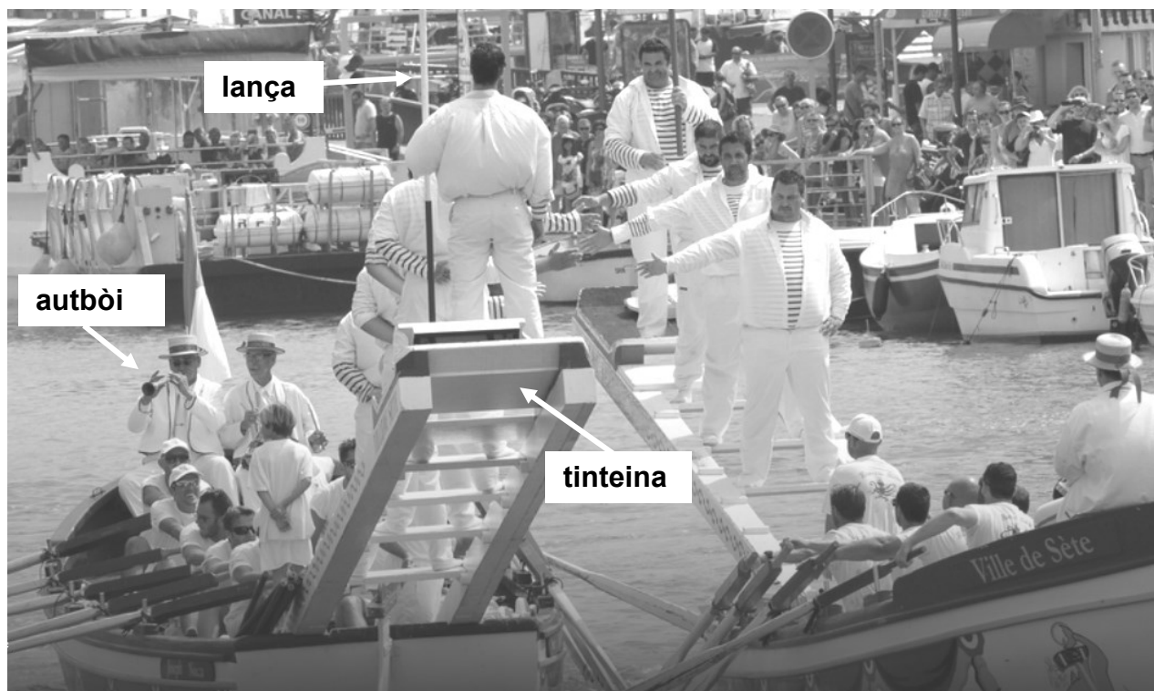
Las ajustas a Seta

(4) peis planièr, sole (5) bouclier (6) dels blaus (7) ils l'ont eu amèrè