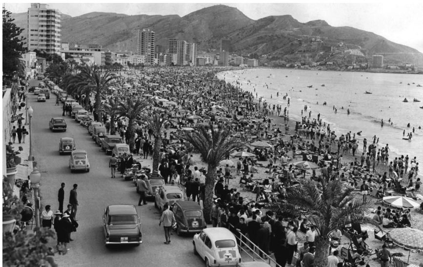
EFE, 1966: http://www.expansion.com/especiales/30-aniversario/turismo-y-transporte/2016/05/06/572b9960ca4741f8098b4583.html