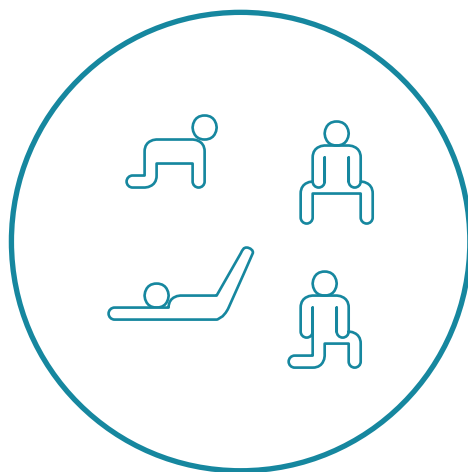
Exemples de porteurs