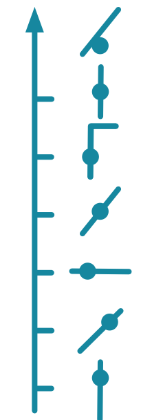
Axe le plus inhabituel d'un des voltigeurs sur porteur