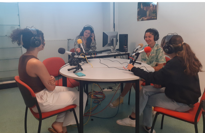
Enregistrement des audios dans le studio du lycée

Inspecteur général de l'éducation, du sport et de la recherche, membre du Conseil supérieur des Programmes, co-pilote du dispositif pédagogique « l'Appel des pôles », écrivain, capitaine de vaisseau (réserve), administrateur de la Fondation de la mer.