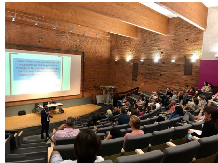
Printemps de l'EMI 2017

Or, même si elle touche plusieurs classes d'âge, la mode du selfie est souvent présentée comme une spécificité juvénile.