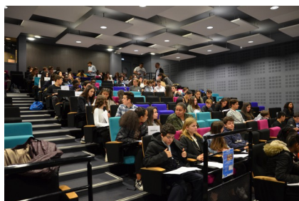
Vue de l'amphithéâtre .

Un brainstorming par petits groupes a été proposé sur plusieurs thèmes : « définir ce qu'est un enfant ? , Qu'est-ce qu'éduquer ? Que permet l'éducation dans sa vie ?