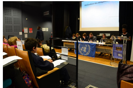
Vue de la tribune