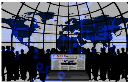
Illustration 1: Pixabay