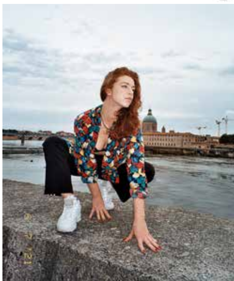
Mafalda High © Obakasan

Le festival Spirale revient pour sa deuxième édition ! Toujours orienté autour de la découverte musicale d'artistes locaux et émergents, le festival, en co-production avec l'association