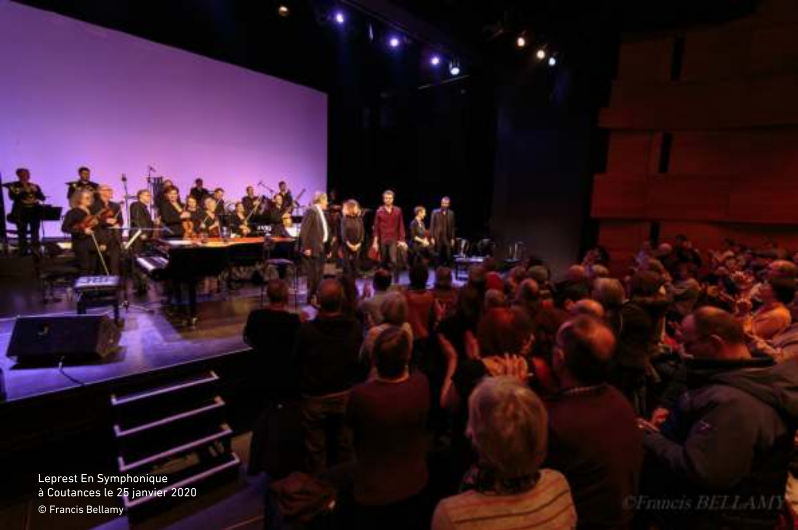
Leprest En Symphonique à Coutances le 25 janvier 2020