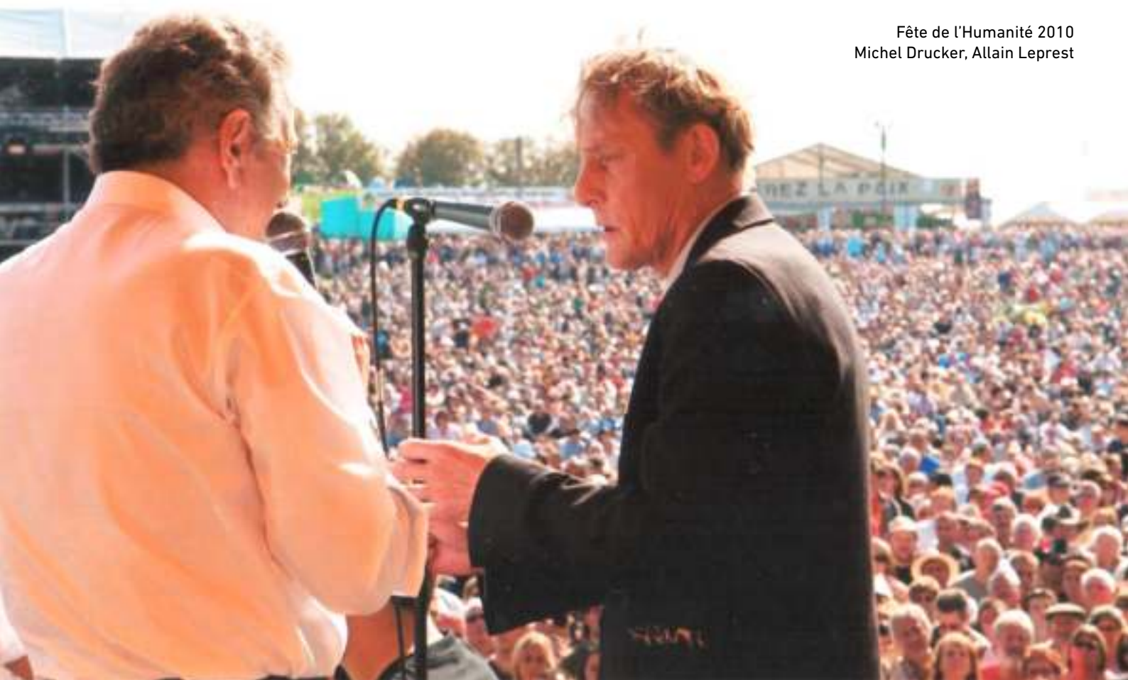
Fête de l'Humanité 2010 Michel Drucker, Allain Leprest