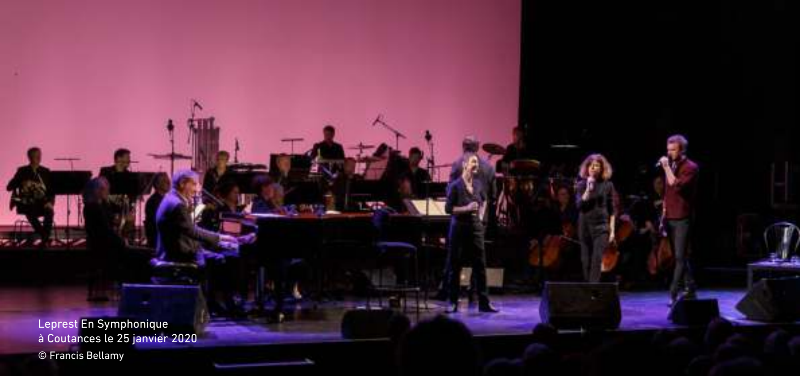
Leprest En Symphonique à Coutances le 25 janvier 2020