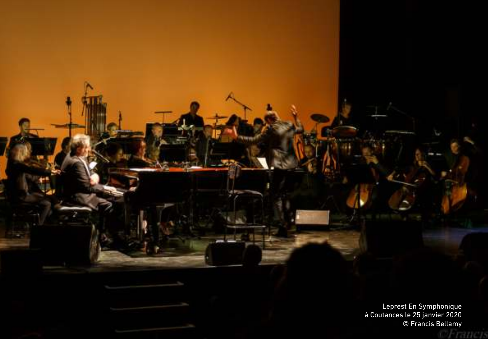
Leprest En Symphonique à Coutances le 25 janvier 2020