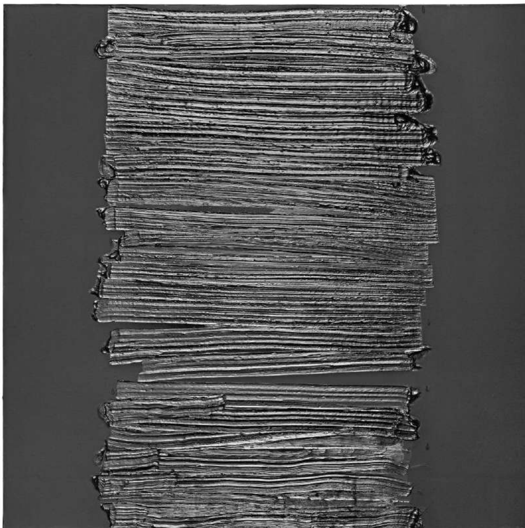
Pierre Soulages peinture 175 x 175 cm, 18 août 2018, collection privée, © archives Soulages. Adagp, Paris 2023

La donation comprend quatre polyptyques de grandes dimensions, trois verticaux et un horizontal : Peinture 324 x 181 cm, 14 mars 1999, Peinture 324 x 181 cm, 19 février 2005, Peinture 244 x 362 cm, 17 septembre 2006, Peinture 324 x 181 cm, 17 novembre 2008 . Il s'agit d'un ensemble cohérent d'œuvres de haute taille, barrées de lignes verticales, peintes ou raclées, lignes noires ou blanches (en réserve). Ces toiles jouent l'ample partition des noirs, du brillant réfléchissant la lumière, au noir mat qui l'absorbe, parfois accosté de bandes blanches. Par ailleurs Peinture 175 x 175 cm, 18 août 2018, Peinture 130 x 81 cm, 4 juillet 2021, Peinture 102 x 130 cm, 15 mai 2022 témoignent des créations les plus récentes du peintre, reconnaissables à la puissance du noir et à l'épaisseur de la matière, à une sorte d'amplification des formes. Ces trois œuvres figurent dans l'accrochage de l'exposition des Derniers Soulages . Le hasard propre à l'œuvre peinte de Soulages y atteint un épanouissement.