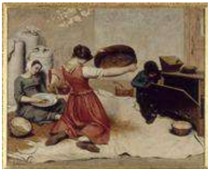
Courbet Gustave (1819-1877) Les Cribleuses de blé Musée des Beaux-Arts, Nantes Format original : H : 131 X L : 167 cm

Format de la bâche (n° 191) : H : 85 X L : 113 cm