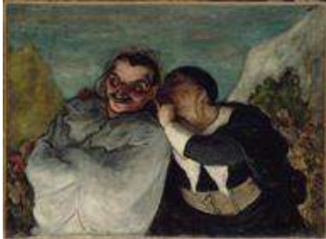
Daumier Honoré (1808-1879) Crispin et Scapin dit aussi Scapin et Silvestre Musée d'Orsay, Paris Format original : H : 61 X L : 83 cm

Format de la bâche (n° 227) : H : 83,5 X L : 115 cm