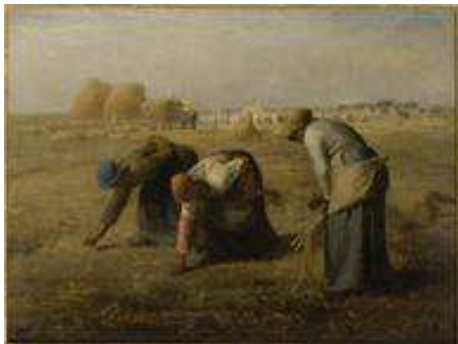
Millet Jean-François (1814-1875) Des glaneuses Musée d'Orsay, Paris Format original : H : 83,6 X L : 111 cm

Format de la bâche (n° 227) : H : 83,5 X L : 115 cm