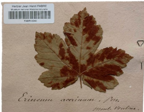
Galle sur feuille d'érable issu de l'herbier

Depuis son plus jeune âge, Jean-Henri Fabre s'est intéressé à la nature. Son engouement pour la botanique vient notamment de son séjour à Ajaccio et de ses nombreuses ascensions du Mont Ventoux. Suite à ses excursions il réalise un imposant herbier.