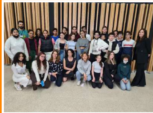
Photo des élèves du lycée Victor Hugo de Marrakech avec la chanteuse Clio, concert en partenariat avec l'Institut français (Maroc).