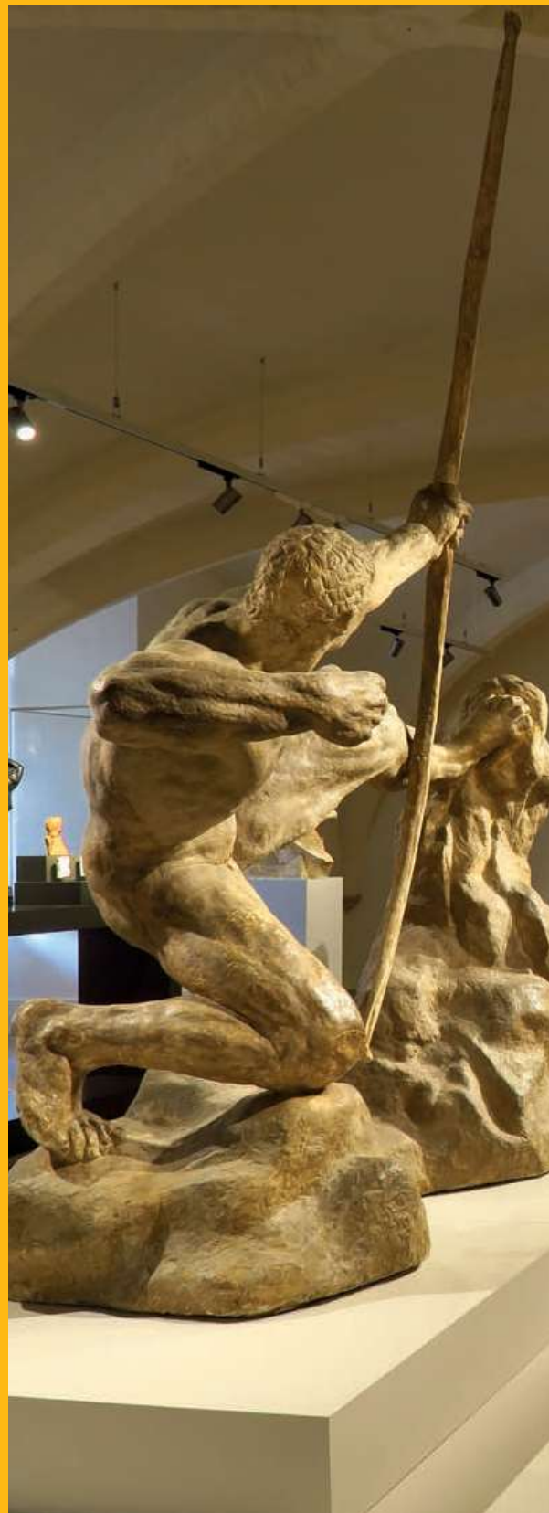
Emile-Antoine BOURDELLE Montauban, 1861 - Le Vésinet, 1929 Héraclès Archer , 1909 Plâtre patiné brun clair

Pour un groupe de 10 élèves. Durée : 1h30.