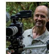
Luc MARESCOT Réalisateur des films Frères des arbres et 700 requins dans la nuit