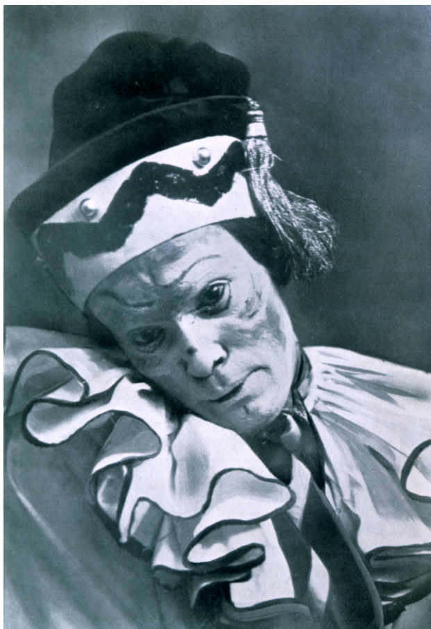
Vaslav Nijinski (1889-1950)