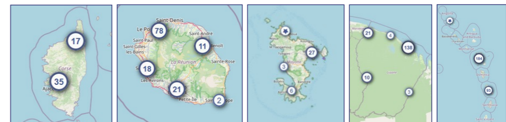
Affichages de la cartographie des partenaires culturels sur ADAGE en zoom large. Les professeurs peuvent centrer la cartographie sur leurs établissements scolaires, 02/08/2022.