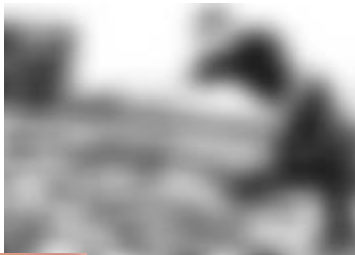
Olivier Debré, Les Doves à Onzain