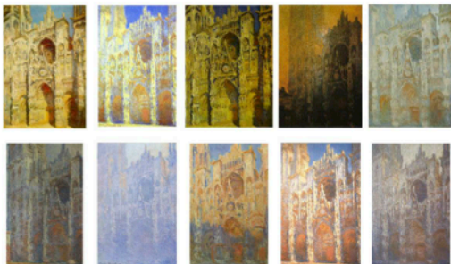
Claude Monet peint de nombreuses fois la cathédrale de Rouen. 1894.