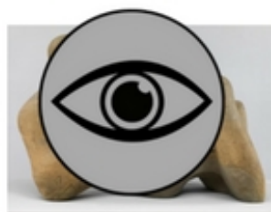
Henry MOORE Recumbent Figure, 1938