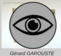
Gérard GAROUSTE Composition II, 1946