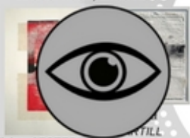
Elaine d'ESTERRE Iron Ore, 2014