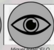
Miquel BARCELO Banderillas, 2015