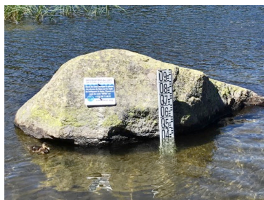
Une règle, installée dans un lac Pyrénéen.

Les classes intéressées par l'opération pourront répondre à l'appel à projet présenté dans la lettre Argonautica de décembre.