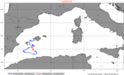
Trajet de Gloria sur Argonautica